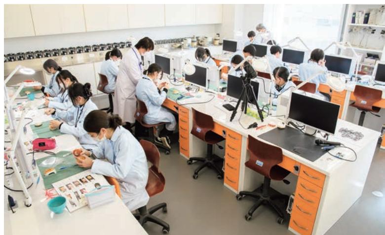
4階 技工・基礎実習室