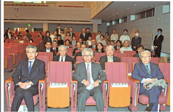
本学関係者や警察関係者などで満席の富士見ホール