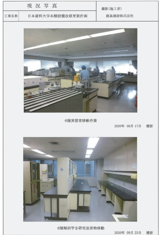
改修工事の進捗状況を報告する鹿島建設の「工事月報」(抄)

東京・富士見の生命歯学部本館は築32年を経過した。本学では3年計画で諸設備の改修工事を順次進めており、天井材と して使用していたアスベスト含有建材の解体や、電気・配管設備などの改修を行っている。 8月末には4階フロアの改修がほぼ完了した。各講座の研究室や講堂、会議室、事務室は工事期間中、他のフロアに移動しながら研究や業務を続 けている。現在は全体の工事の約16%が完了した。改修工事の竣工は2023年(令和5)3月末の予定である。