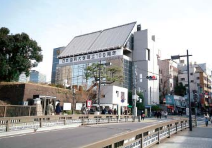
牛込橋より見る飯田橋駅前の本学体育館(下)。元は、黒門のある旗本屋敷跡。昭和43年まで本学教職員寮があった(上)