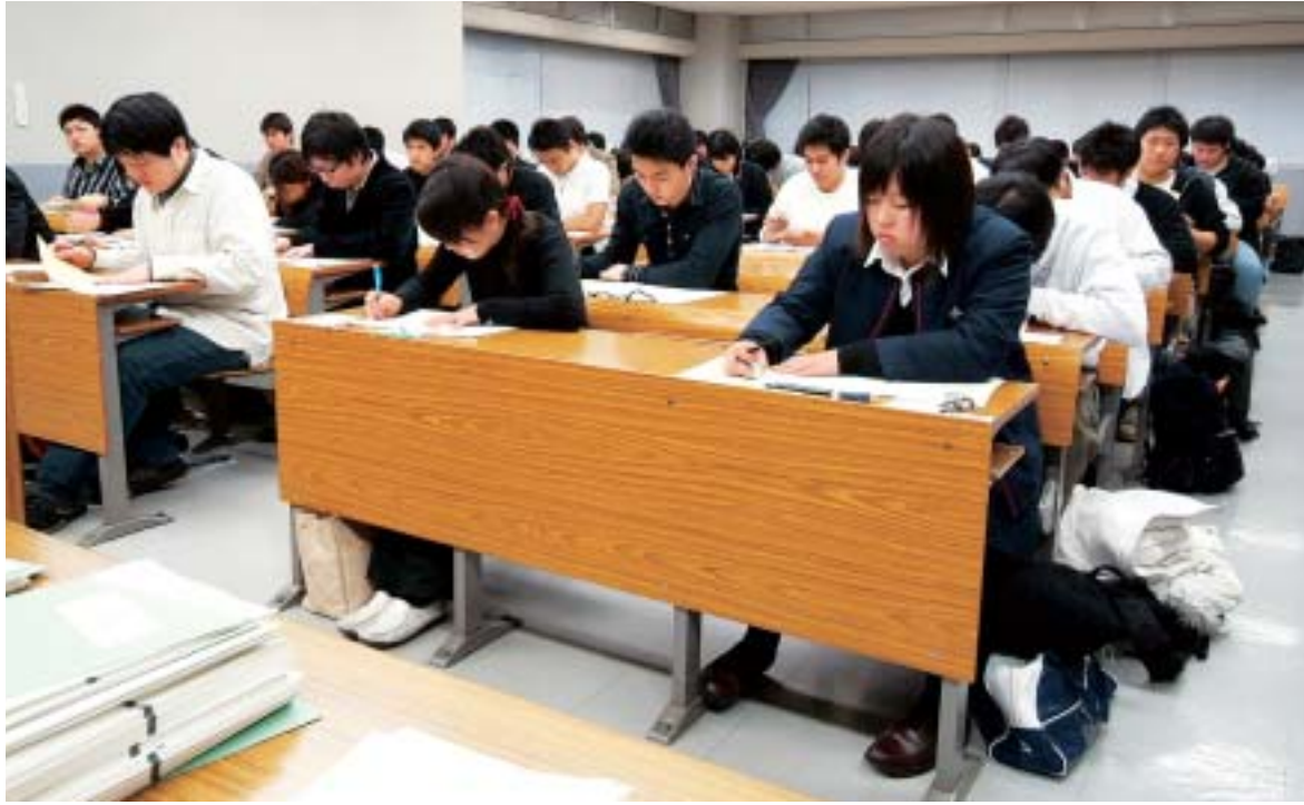
試験問題に取り組む受験生たち(2月1日・歯学部)