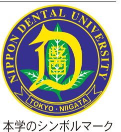
本学のシンボルマーク